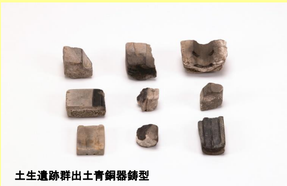
土生遺跡群出土青銅器鑄型