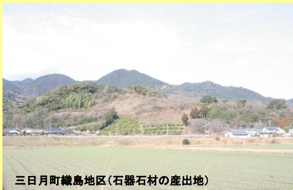
三日月町織島地区(石器石材の産出地)