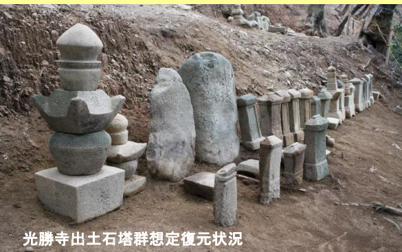
光勝寺出土石塔群想定復元状況