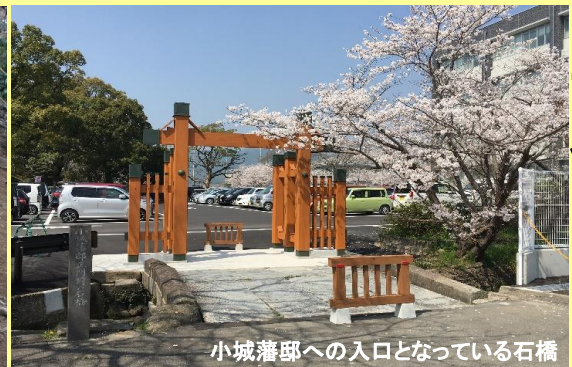
小城藩邸への入口となっている石橋