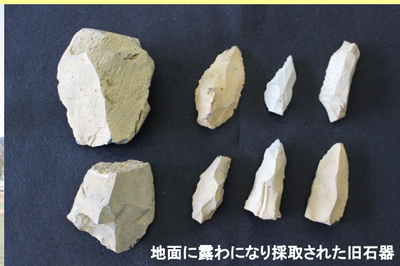
地面に露わになり採取された旧石器